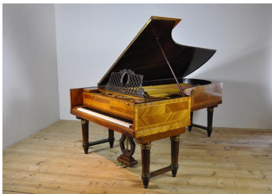
C. Bechstein, Norfolk - England, Op. 48452 um 1899

Moderne englische Mechanik, Tastenumfang 7 \frac{1}{4} Oktaven A2-c5, 2 Pedale: Aushebung der Dämpfung (Forte) und Verschiebung der Mechanik (Piano).